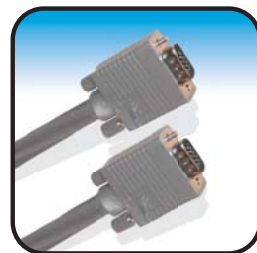
PROFESSIONAL VIDEO cable