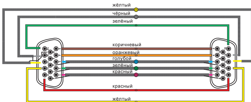
Схема распайки кабеля: