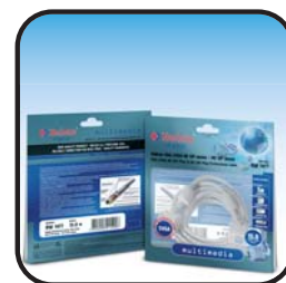
УПАКОВКА ПРОЧНЫЙ ПАКЕТ